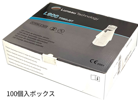
100個入ボックス (サイズ: 29cm X 23cm X 7.6cm)